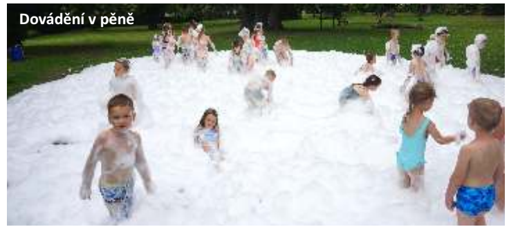
Dovádění v pěně