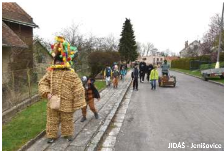
JIDÁŠ - Jenišovice

Někteří z vás mě možná znají. Každý rok v době předvelikonoční Bílé soboty se pohybují v lokalitách kolem Vysokého Mýta, Hrochova Týnce a okraje Pardubic a snažím se pro ty, kdo přijdou po nás, dokumentovat lidový zvyk s velmi starými kořeny.