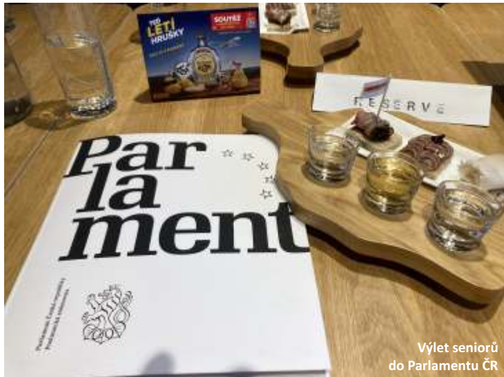
Výlet seniorů do Parlamentu ČR