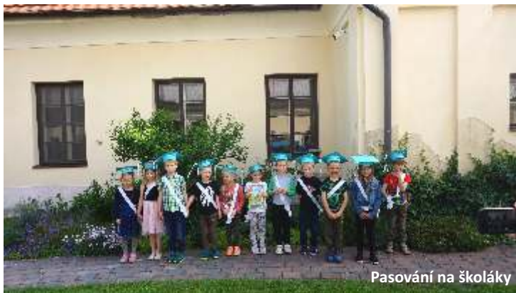
Pasování na školáky

Nakonec si pohrály s kamarády z Dobříkova a na zpáteční cestu se posilnily melounem a popcornem! Moc děkujeme pracovnícím MŠ Dobříkov za parádní dopoledne.