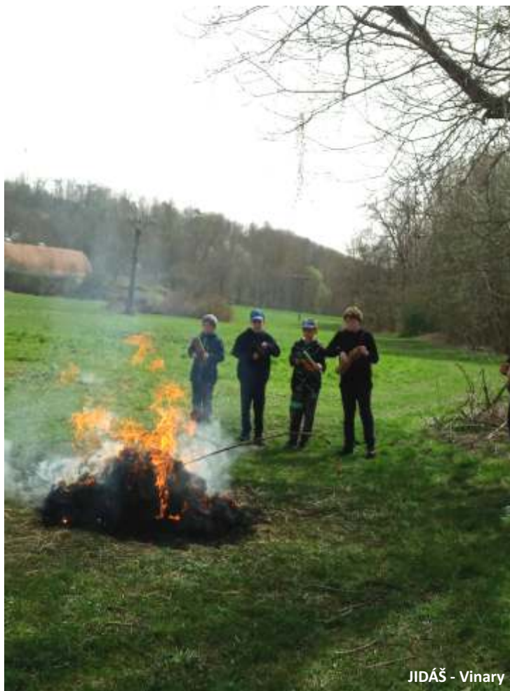
JIDÁŠ - Vinary