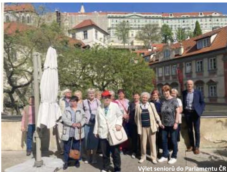
Výlet seniorů do Parlamentu ČR

Na konci dubna uspořádala Kulturní komise ve spolupráci s Obcí Zámorsk výlet do Poslanecké sněmovny Parlamentu České republiky. Odjeli jsme brzy ráno od obecní prodejny v Zámorsku, několik výletníků přistoupilo i v Janovičkách na nádraží a v Týnišťku. Měli jsme dostatek času, takže jsme se zvládli zastavit i na krátké občerstvení na benzínce před Prahou.