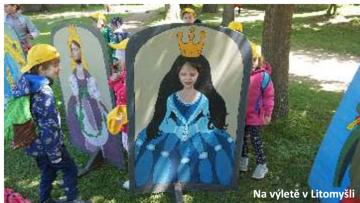
Na výletě v Litomyšli

Mohlo by se zdát, že tím jsme školní rok zakončili. Ale to by byl omyl! Na děti čekala ještě dvě překvapení. Prvním byl výšlap do Dobříkova na jubilejní 20. ročník akce „Dobza“. A když jubilejní, tak s velkou parádou ve stylu párty! Děti i dospěláci nás uvítali na nazdobené zahradě. Jen co jsme se po dlouhé cestě posilnili, čekal nás společný tanec. Po rozdělení do družstev si děti na jednotlivých stanovištích postupně vyráběly parádní „placky“ s nápisem “MŠ Dobříkov, MŠ Zámrsk 2025, 20 let spolu“, zdobily nafouknuté balóny a slavnostní dorty, zdolávaly překážkovou dráhu pártý čepičkou a házely na cíl.