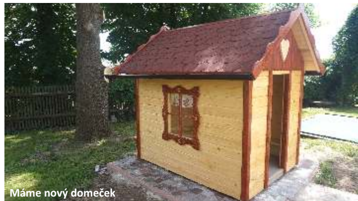
Máme nový domeček