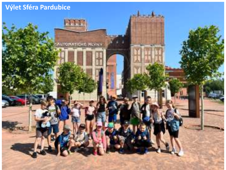
Výlet Sféra Pardubice