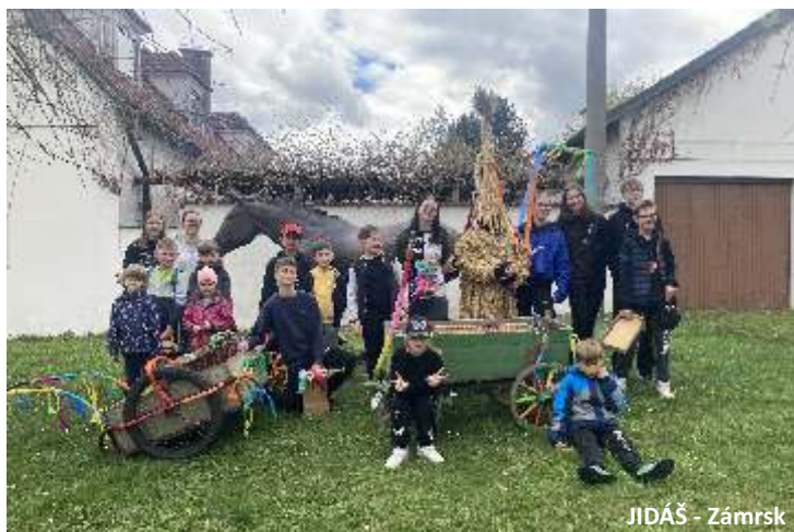
JIDÁŠ - Zámorsk

Fotografie dokládají realizaci zvyku například v Jenišovicích, Radimě či Vinarech v roce 2024