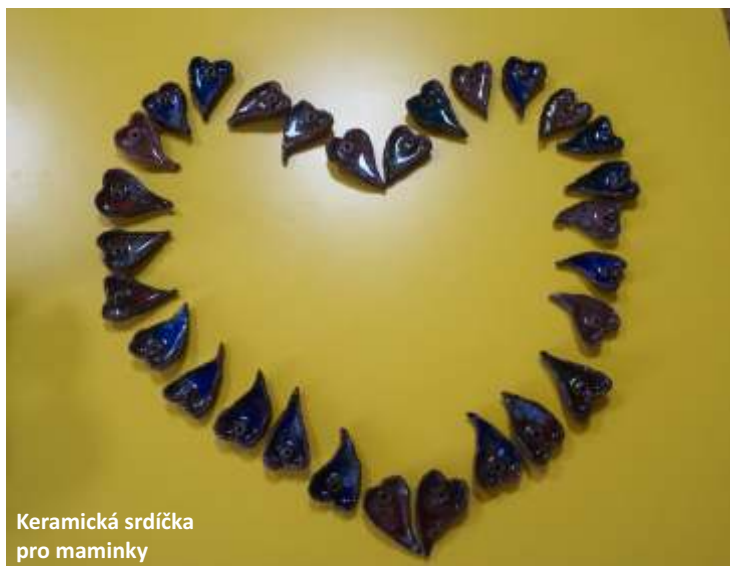
Keramická srdíčka pro maminky

Školní rok se pomalu blížil ke konci. Pilní sběrači sušené kůry a hliníku byli oceněni diplomy a drobnými dárky. Jsme rádi, že se do sběru hliníku opět zapojili nejen rodiče dětí ze školky, ale i další naši