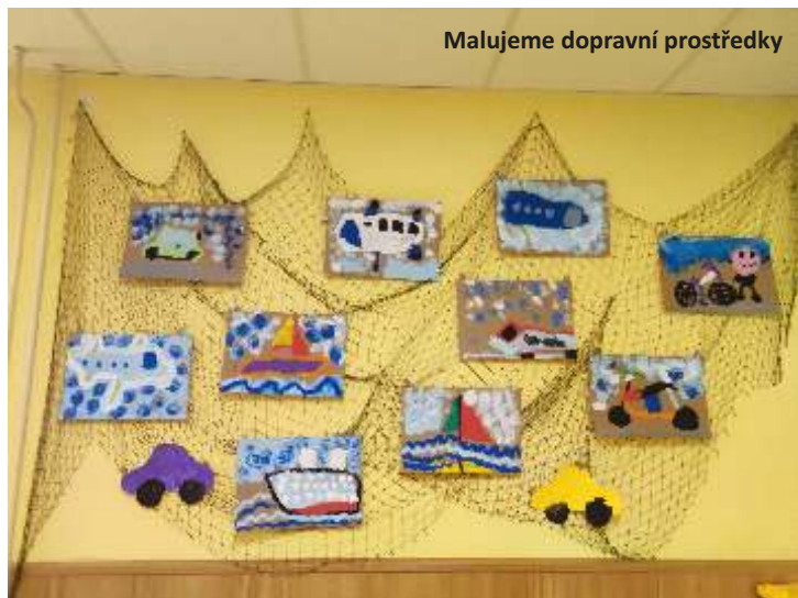
Malujeme dopravní prostředky

spoluobčané. Všechny děti si pak společně se žáky 1. a 2.třídy základní školy užily spoustu legrace během netradiční pohádky pana Hrušky zakončené diskotékou.