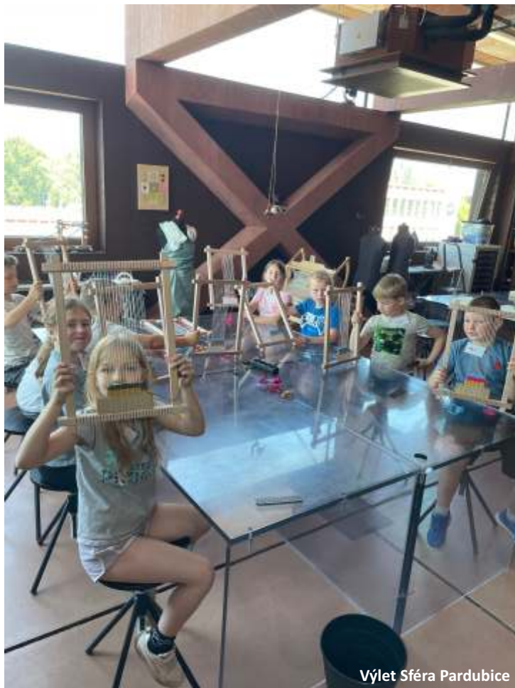
Výlet Sféra Pardubice

V dubnu proběhl velikonoční jarmark - s žáky jsme se domluvili, že by si za vydělané peníze koupili něco společného. Nakonec se žáci domluvili na stavebnici LEGO. Ta udělala všem obrovskou radost.