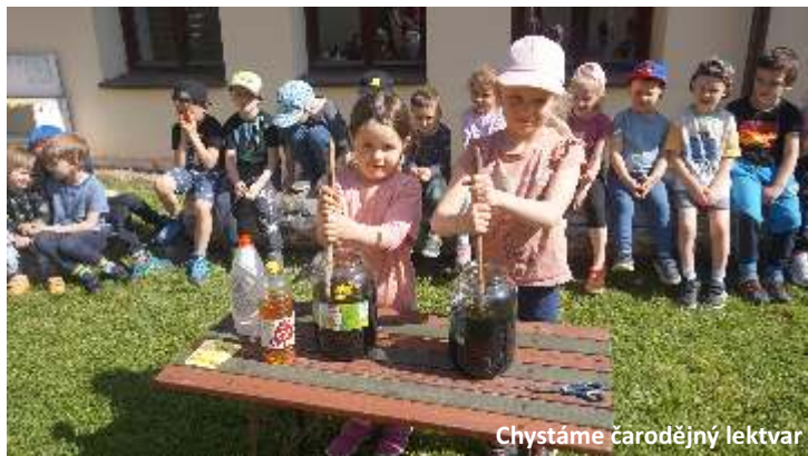
Chystáme čarodějný lektvar

Sluníčko nám přálo a tak jsme mohli trénovat na závody v lehkotletickém trojboji, který pro děti z jednotřídních mateřských škol každoročně pořádá mateřská škola v Českých Heřmanicích. A vyplatilo se! Naše děti v opravdu velké konkurenci uspěly a získaly celkem 6 medailí. Jak ale stále opakujeme dětem, není důležité zvítězit, ale zúčastnit se a hlavně si to užít! Nikam jsme nespěchali, počasí vyšlo překvapivě krásně a tak si děti kromě sportovního zápolení vydatně užily i průlezek, válení sudů, kolotoče, zamlsaly si, pozorovaly čápy s třemi mladými na nedalekém komíně - prostě den jak má být. Však taky po návratu málokdo vydržel poslouchat každodenní četbu pohádky před poledním odpočinkem až do konce.