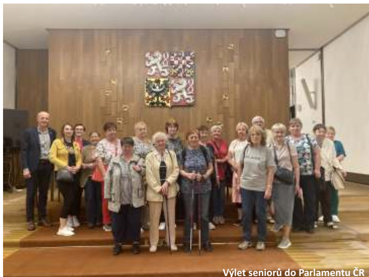
Výlet seniorů do Parlamentu ČR

Zavítáte-li do muzea R. Jelínka, nejen že se dozvíte mnohé z historie této světově známé firmy, ale stanete se na chvíli švestkou a budete ve 3D kině sklizeni, semletí, zkvašeni, vypálení, skapání, sliti, zabalení a odvezení. To vše za intenzivních otřesů, klepání, stoupání, klesání, tepelných vjemů. Je to silný zážitek.