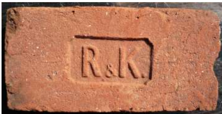
Cihla Ressler Kudlík Zámrsk

Sbírka Regionálního muzea ve Vysokém Mýtě je velmi rozsáhlá a skupina zvaná architektura – části staveb obsahuje i desítky kusů cihel a střešních tašek regionální produkce. Zatím nám ale zcela chybí zástupci dvou cihel fungujících v Zámrsku. A proto se obracíme na vás – čtenáře. Pokud byste měli možnost nám pomoci s doplněním souboru.