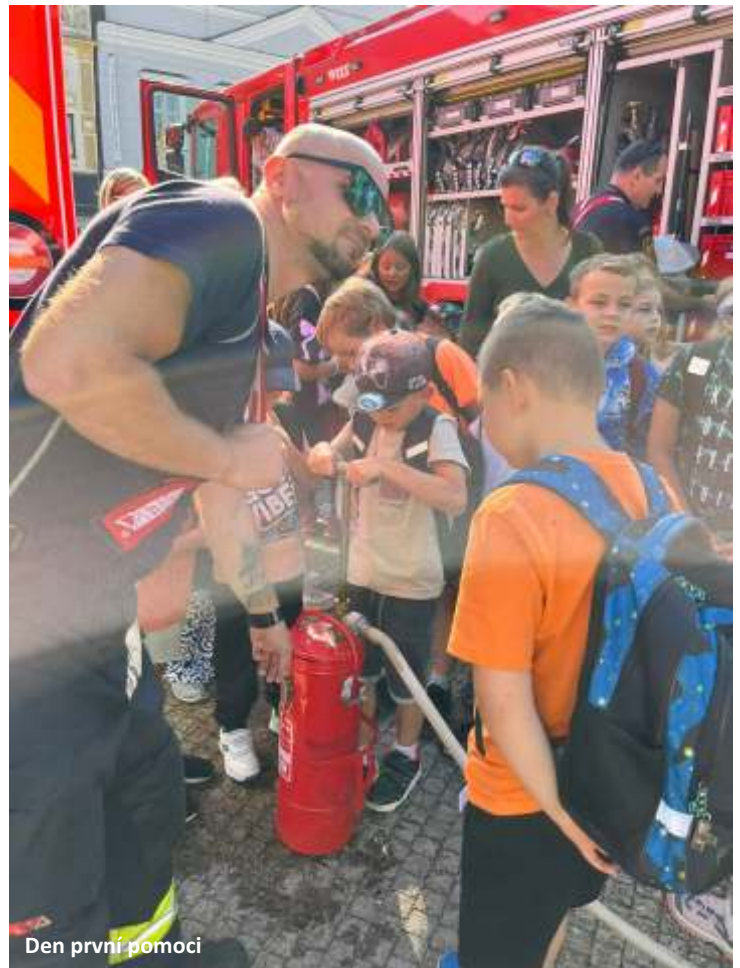
Den první pomoci

Na začátek školního roku nám letos připadl i plavecký kurz, na který pravidelně jezdíme každou středu. Ale nezašli ani školní družina, pokud je vhodné počasí vyrazí na vycházku do okolí, sbírá přírodniny (začali jsme se sběrem kaštanů pro zvířátka), vymýšlí různé hry a dokonce mají i kosmetický salon, kam mohou chodit jako ke kadeřníkovi.