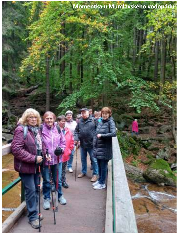
Momentka u Mumlavského vodopádu

Zachovejte nám věrnost, my ji také zachováme.