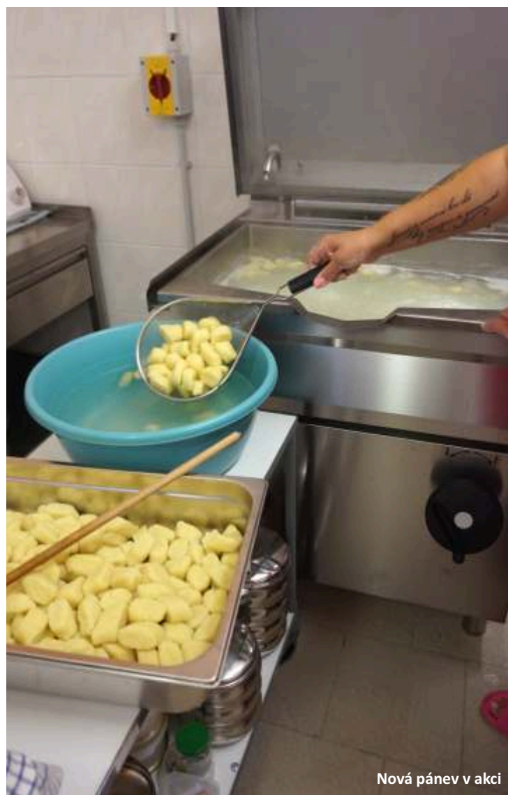
Nová pánev v akci