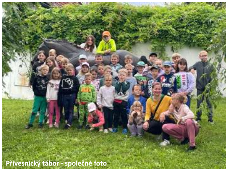
Přívěsnický tábor - společné foto