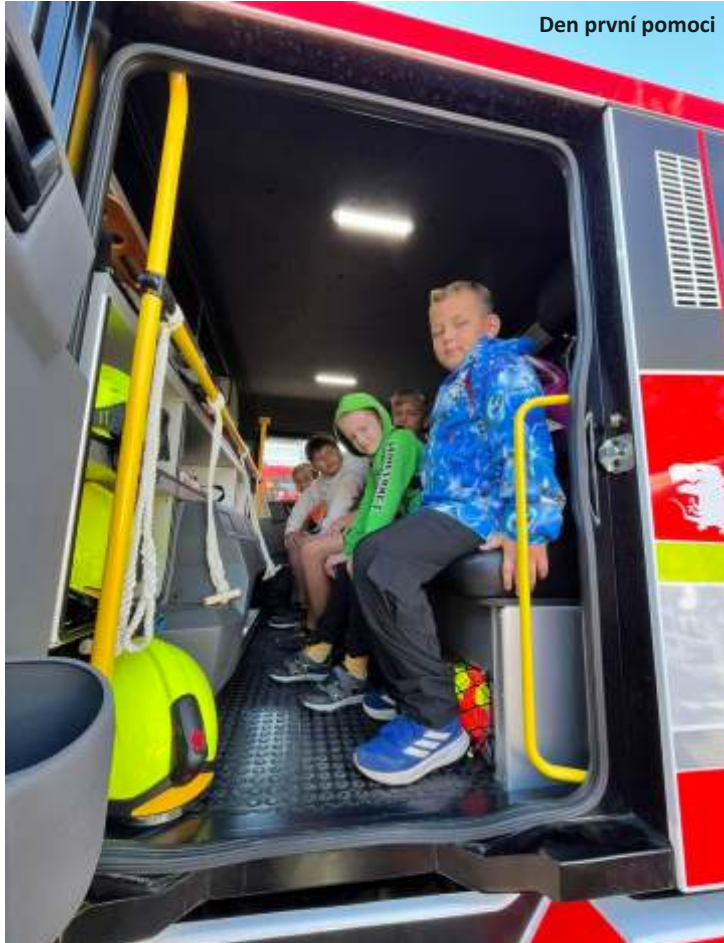
Den první pomoci

První školní den jsme se stávajícími žáky školy přivítali 11 prvňáčků. Pro všechny naše žáky jsme o prázdninách připravili plno novinek. Celá škola se tento rok promění na „Akademii čar a kouzel“. Za odměnu žáci získávají jednotlivé ingredience v podobě zalaminovaných obrázků, ze kterých pak mohou vytvářet lektvary. Lektvary si pak lepí do své knížky. Za každý lektvar získávají body pro svůj tým. Ve škole se nám také objevily i kouzelné bytosti jako jsou draci, jednorožci, skřítky, kouzelné sovy a fénixové.