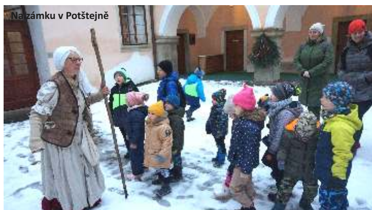
Na zámku v Potštejně