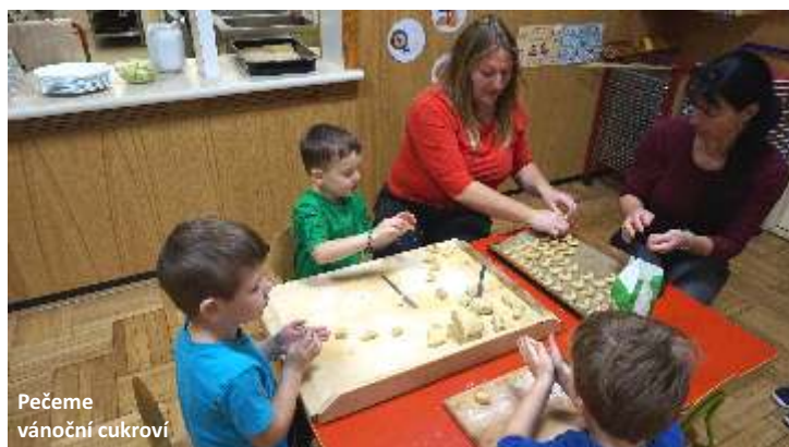
Pečeme vánoční cukroví