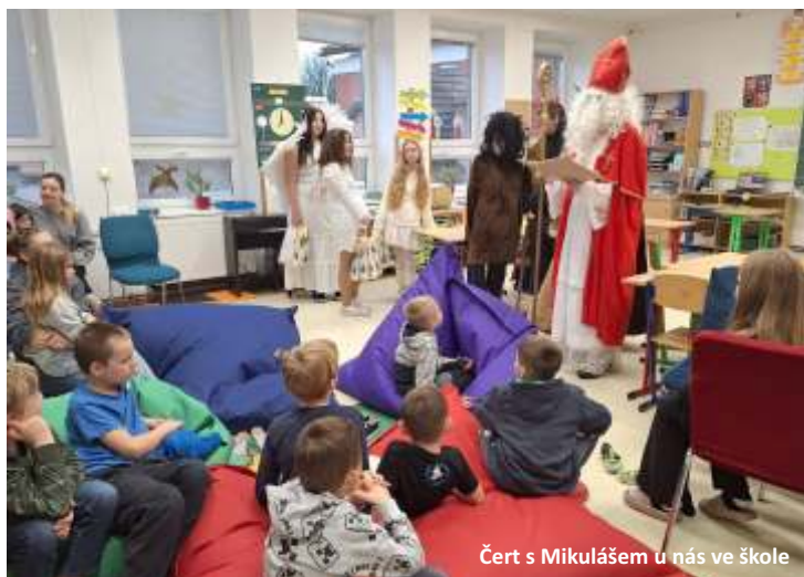
Čert s Mikulášem u nás ve škole

dovolte mi ohlédnout se za stávajícím rokem 2025. Jaké akce se nám podařily, co nám ve škole udělalo velkou radost? V první řadě nás těší zájem rodičů o naši malou školičku. Za sebe mohu říci, že nepamatuji více žáků v první třídě, než letošní počet prvňáčků. Do školy jich prvního září nastoupilo 11! Z akcí je třeba zmínit Velikonoční jarmark, Jarní slavnost, která podpořila spolupráci s mateřskou školou. Těší nás i zájem rodičů o přívěsnický tábor.