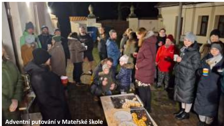
Adventní putování v Mateřské škole

V naší mateřské škole jsme si podzim užili opravdu naplno. Děti jsme seznamovali s podzimními plodinami, jako jsou brambory či řepa, a společně jsme objevovali, jak různě může chutnat a vonět ovoce a zelenina. Nechyběla ani praktická část – děti si samy připravily ovocný salát, který si poté s velkou chutí snědly.