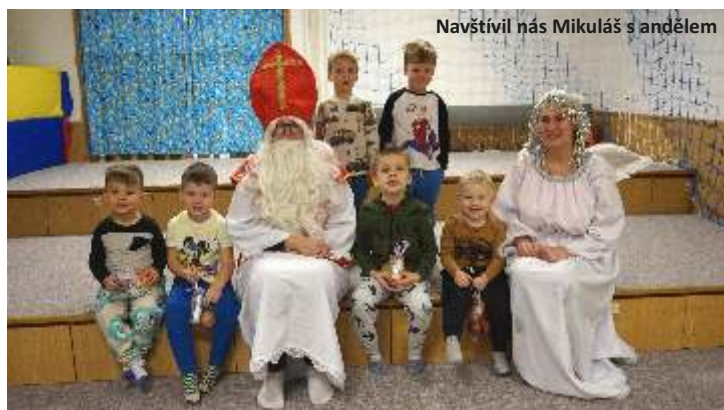
Navštívil nás Mikuláš s andělem