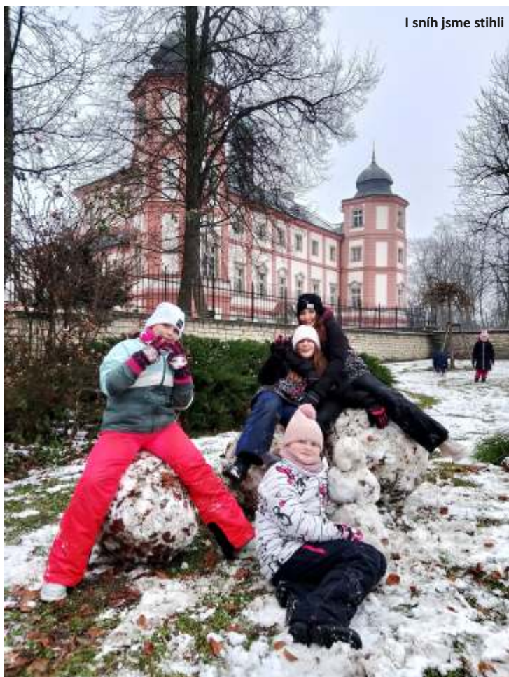
I sněh jsme stihli

V letošním školním roce stojí za zmínku projekt - Centra aktivit s tématem LES. Žáci jsou rozděleni v celoroční hře do kolejí. Na každý den připadalo jedno centrum (centrum Čtení, Psaní, Matematiky, Věda a objevy a poslední Ateliér). V Ateliéru žáci společně tvořili z přírodnin. Krajinka se jim opravdu povedla. V centru Matematiky měli malované příklady, kdy si nejprve museli zjistit, jaké číslo znamená který obrázek.