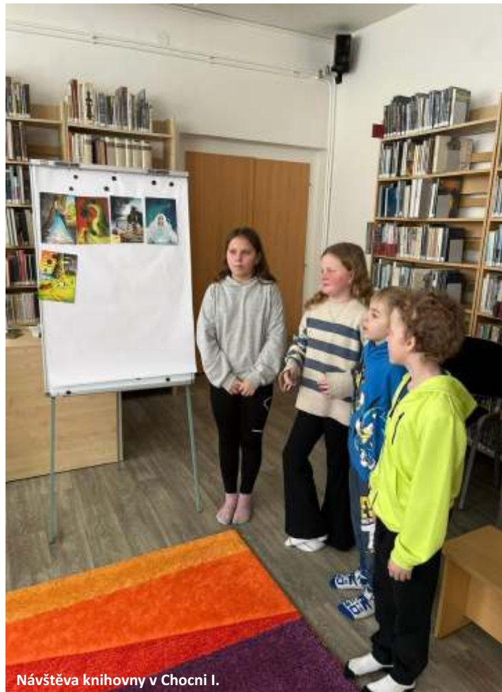
Návštěva knihovny v Chocni I.

máme za sebou první čtvrtletí roku 2026. Ve škole se již tradičně odehrálo několik akcí. Hned v lednu proběhl Den otevřených dveří, kde si zájemci mohli vyzkoušet pokusy, pracovat s novými pomůckami v informatice nebo si proběhnout opičí dráhu v tělocvičně. Na začátku února pak proběhl zápis do 1. ročníku. Letos jsme zapsali 9 nových žáčků, na které už se moc těšíme.