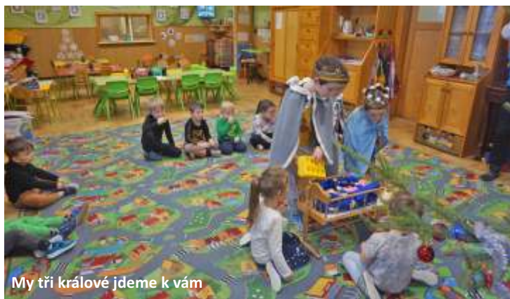
My tři králové jdeme k vám