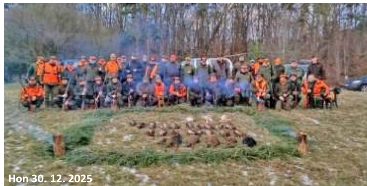
Hon 30. 12. 2025

Touto cestou bych chtěl poděkovat zastupitelům obce Dobříkov za schválení příspěvku na opravu těchto voliér. Letos na jaře nás čeká nahození zdi a natažení pletiva, abychom mohli nové prostory začít plně využívat. Děkuji také obci Zámřsk za příspěvek na spolkovou činnost a věřím, že dobrá spolupráce se starostkami obou obcí bude i nadále pokračovat.