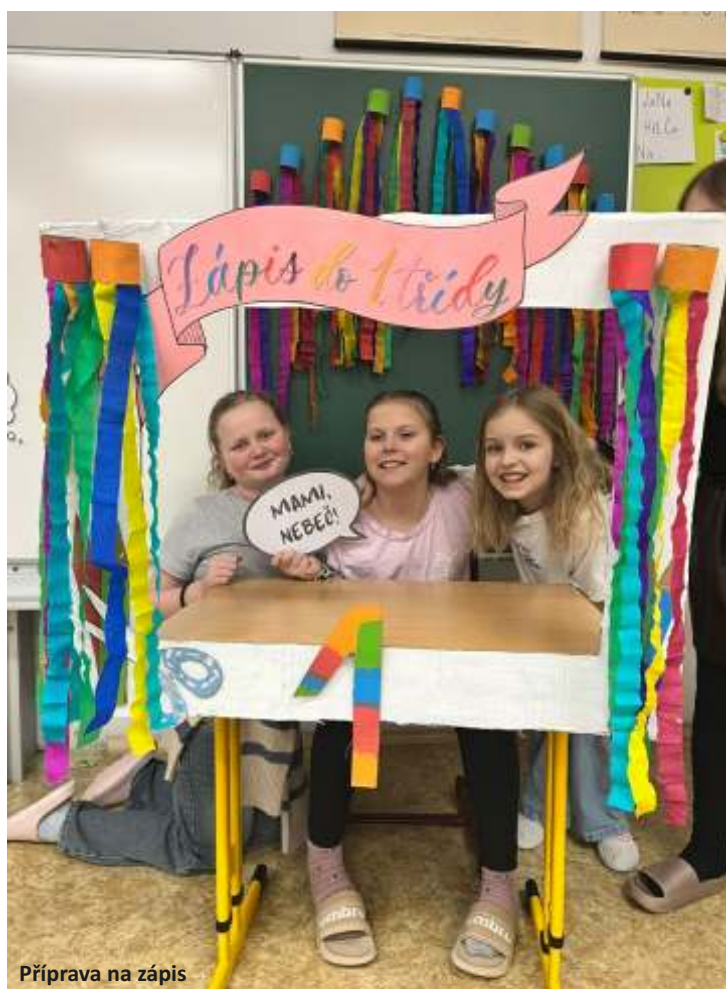
Příprava na zápis

S blížícími se velikonočními svátky jsme chystali také tradiční Velikonoční jarmark. Ten proběhl 1. dubna na netradičním místě – v prostorách SPOZu. Žáci pilně tvořili své výrobky, ve středu dopoledne