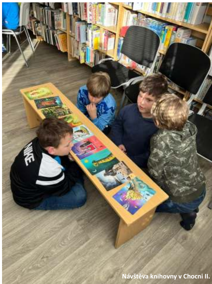
Návštěva knihovny v Chocni II.

Po vydatné večeri jsme se vydali do parku hledat v týmech „Svěrákův pergamen“. Nějaký lotr ho roztrhal a rozházel po celém parku. Děti proto hledaly jednotlivé cary pergamentu a pokoušely se ho sestavit. To se jim samozřejmě podařilo. Druhý den jsme se pak společně zapojili do akce „Uklidme Česko“.