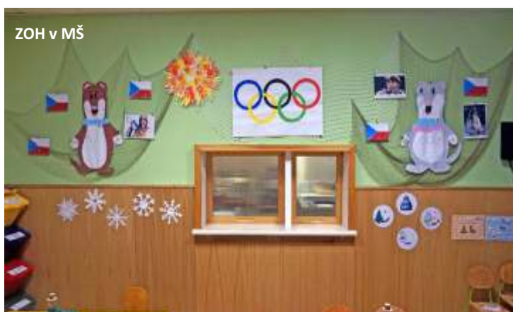
ZOH v MŠ