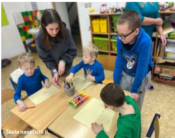
Škola nanečisto II

ještě připravili občerstvení a ve 14 hodin mohl jarmark začít. Děkujeme všem, kteří zavítali mezi nás a zakoupili naše velikonoční výrobky! Možná jste si všimli, že v letošním roce zatím neproběhl karneval. Ten letos plánujeme netradičně na 4. června, kdy se uskuteční společně se „Školním Zámrskáním“ v zámeckém parku.