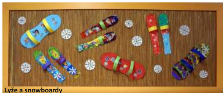
Lyže a snowboardy

Předškoláky čekal důležitý životní krok – zápis do základní školy. Proto trénovali, opakovali a procvičovali vědomosti a dovednosti, které by před nástupem do školy měli zvládnout. Školu jsme se všemi dětmi také navštívili. Role učitelů tentokrát perfektně zvládli žáci 5. ročníku, kteří děti učili poznávat písmena, číslice či vybarvovat omalovánky. Děti si také vyzkoušely hodinu tělesné výchovy. Děkujeme žákům i pedagogům za příjemné dopoledne i za hezké dárečky, které našim dětem připravili.