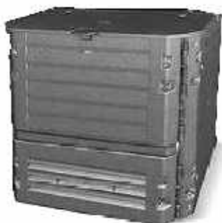
Kompostér Thermo King 900 I