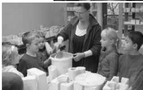
V keramické dílně