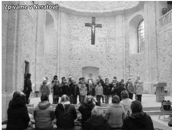
Zpíváme v Neratově