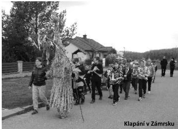
Klapání v Zámrsku

Poprvé se sejdeme ve středu 17.4. v 18 hodin v Rajčuru. Pokud bude pršet tak na hřišti pod střechou. Kdo má klapačku nebo hrkačku vezměte ji s sebou. Kdo nemá, ať přijde také. Bude možnost zapůjčení klapaček z obecních zásob.