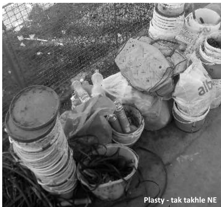
Plasty - tak takhle NE