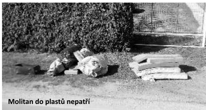
Molitan do plastů nepatří

Úvodem tohoto prvního čísla jsme se rozhodli věnovat odpadům. Je to možná příhodné, protože zvláště v jarním období máme potřebu uklízet a zbavovat se všeho nepotřebného. Odpadů ale produkujeme stále více a i u nás v obci se čím dál častěji potýkáme se starou nerudovskou otázkou: „Kam s ním?“