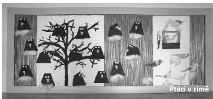
Ptáci v zimě