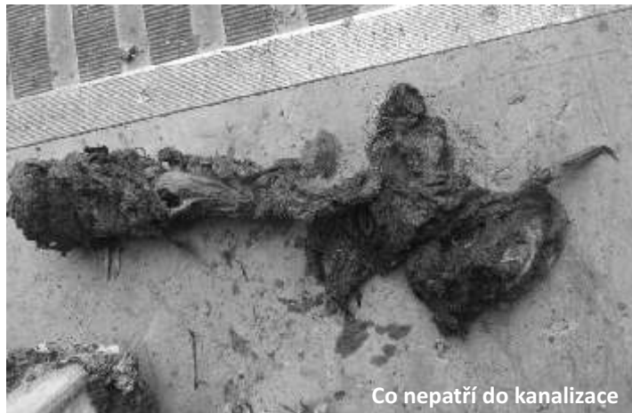
Co nepatří do kanalizace

Správu naší obecní kanalizace vykonává VaK Vysoké Mýto a provádí i veškeré opravy kanalizace. Náklady na opravu pak započítává do ceny, kterou obci účtuje. Cena služeb, prováděných VaKem, se následně promítá do výpočtu pro budoucí stočné.