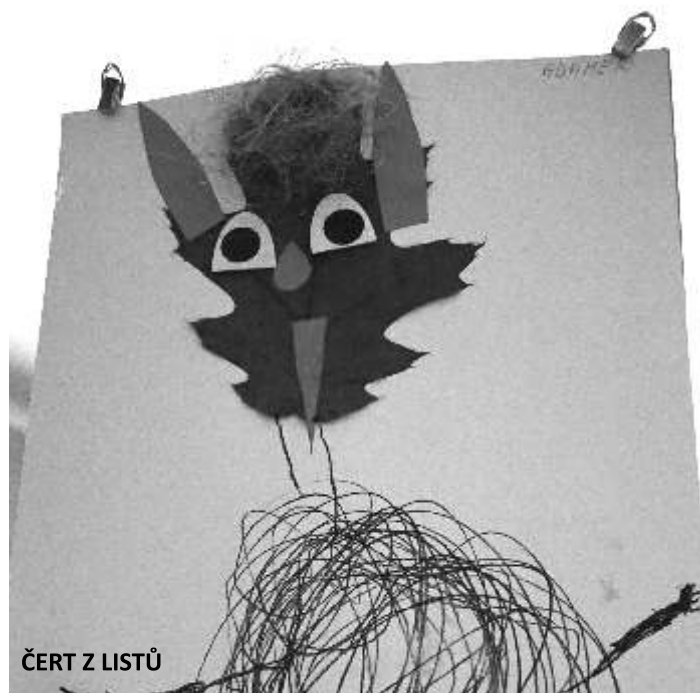
ČERT Z LISTŮ