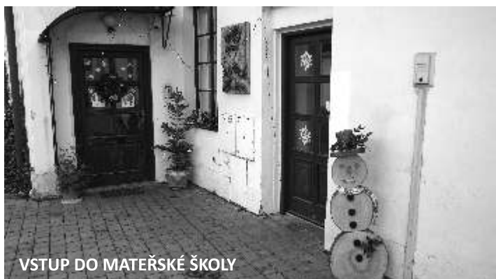
VSTUP DO MATEŘSKÉ ŠKOLY

Drakiáda skončila a podzim se nahnal ke svému konci. Děti v mateřské škole poznávaly stromy, keře a jejich plody. Otiskovaly listy potřené barvou, lepily listy na čtvrtky se zapuštěnou barvou, navlékaly žaludy a kaštiny... Prostřednictvím pohádek „Princeznička na bále“ a „O veliké řepě“ poznávaly polní plodiny a způsob jejich využití a zpracování, ale také se učily pracovat se svým hlasem, počítat, orientovat se v prostoru a poznat pořadí (před, za, mezi, první, poslední), procvičovaly uvolnění ruky při grafomotorických cvičeních, zpívaly, rytmizovaly, tančily, navlékaly korále z brambor, tiskaly bramborovými tiskátký, házely papírové brambory do koše i na cíl atd. Podobné to bylo i s přípravou na oslavu sv. Martina. Prostřednictvím dramatizace příběhu o sv. Martinovi děti poznávaly význam pomoci potřebným, seznámily se s pověstmi (například proč se na sv. Martina pečou husy), s lidovými tradicemi a pranostikami (z vystříhaných papírových cihel lepily komíny různých výšek podle věku dětí a dokreslily k nim kouř – „Na svatého Martina, kouřívá se z komína“), vyráběly koně různými výtvarnými technikami, učily se zatloukat hřebíky do podkopy,