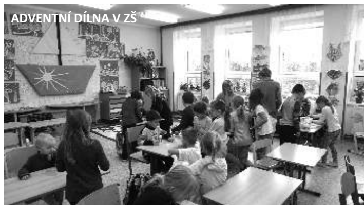
ADVENTNÍ DÍLNA V ZŠ

poznávaly počáteční hlásku ve slově, počítaly barevné vločky. Nezapomněli jsme ani na výzdobu výlohy obecní prodejny – děti stříhaly a vybarvovaly domy, hvězdy a pomocí raznice vyráběly sněhové vločky.