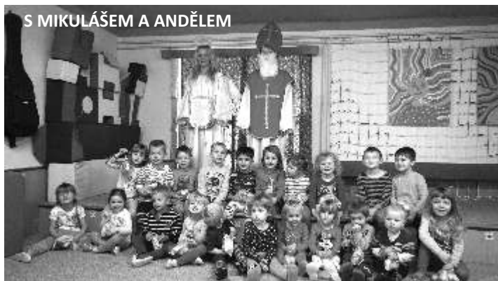
S MIKULÁŠEM A ANDĚLEM