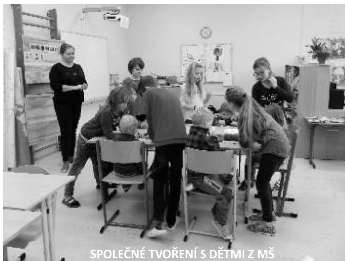
SPOLEČNÉ TVOŘENÍ S DĚTI Z MŠ