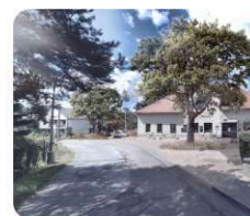
C. nový strom a povrch před hostincem