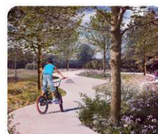
E. sad s dětským hřištěm, ohništěm a skejťovou dráhou