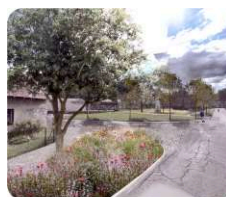
A. náves a bezbariérové zpřístupnění potravin

SAD: Do dnešní mezery v zástavbě, vzniklé díky prolínajícím se ochranným pásmům, vkládáme souměrnou kompozici okrasných hrušní. Sad neplodí, zato nabízí teple pohostinnou atmosféru pod svými korunami, kde vzniká prostor pro volný čas a hru dětí různého věku, které jinak ve veřejném prostoru nenachází své vlastní místo. „Sadem nesadem“ se vine zvlněná linie stezky pro skate, brusle nebo koloběžky. Uvnitř sadu se nachází plocha s basketovým košem doplněná o dřevěné platformy k odpočinku. STROM: Před vstupem do obecního hostince vytváříme příjemnější místo pomocí vysokého jilmu vysazeného v kvetoucím záhoně. Strom zvýrazňuje stavbu, nabízí stín v letních měsících, a je odkazem na historicky významnou hospodářskou funkci používání vysokokmenných stromů. Předláždění prostoru vytváří hranici mezi prostorem pro chodce a motoristy. Stává se přirozenou vodící linií podporující bezpečnost.”