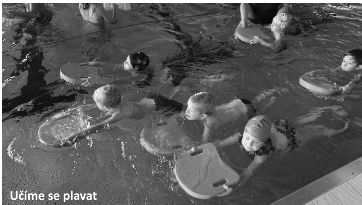
Učíme se plavat

Děkujeme všem, kteří se do aktivit s dětmi zapojili. Nejdůležitější, čím můžeme obdarovat své blízké je láska a čas, který s nimi strávíme a pozornost, kterou jim budeme věnovat. Přejeme proto nejen dětem, ale i všem dospělým dostatek společně stráveného času, lásky a pozornosti nejen o Vánocích, ale i po celý následující rok.