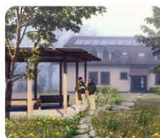
D. zahrada penzionu s altánem a novou výsadbou