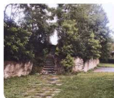
G. nové propojení s rezidenční částí