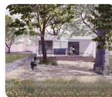
B. zpevněná plocha před potravinami