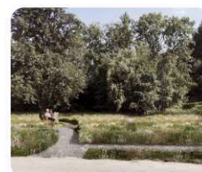
F. louka s průsečími a zpřístupnění břehů řeky