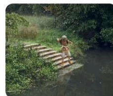
H. schody u mostu